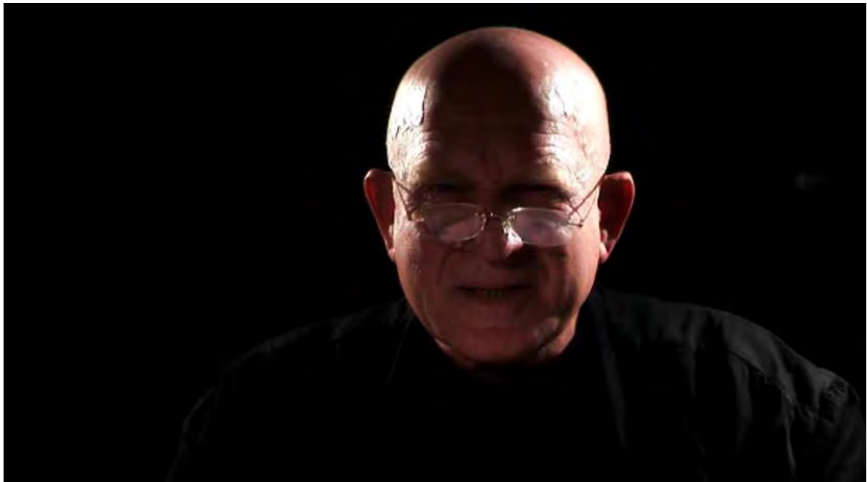
HENRYK TALAR NA PLANIE FILMU „OKRUCHY ROZBITEGO DZBANA” 2011

Fragmenty tekstów Gulbinowicza w filmie czyta znakomity aktor Henryk Talar, który przed laty, podczas pobytu we Wrocławiu poznał głównego bohatera filmu.