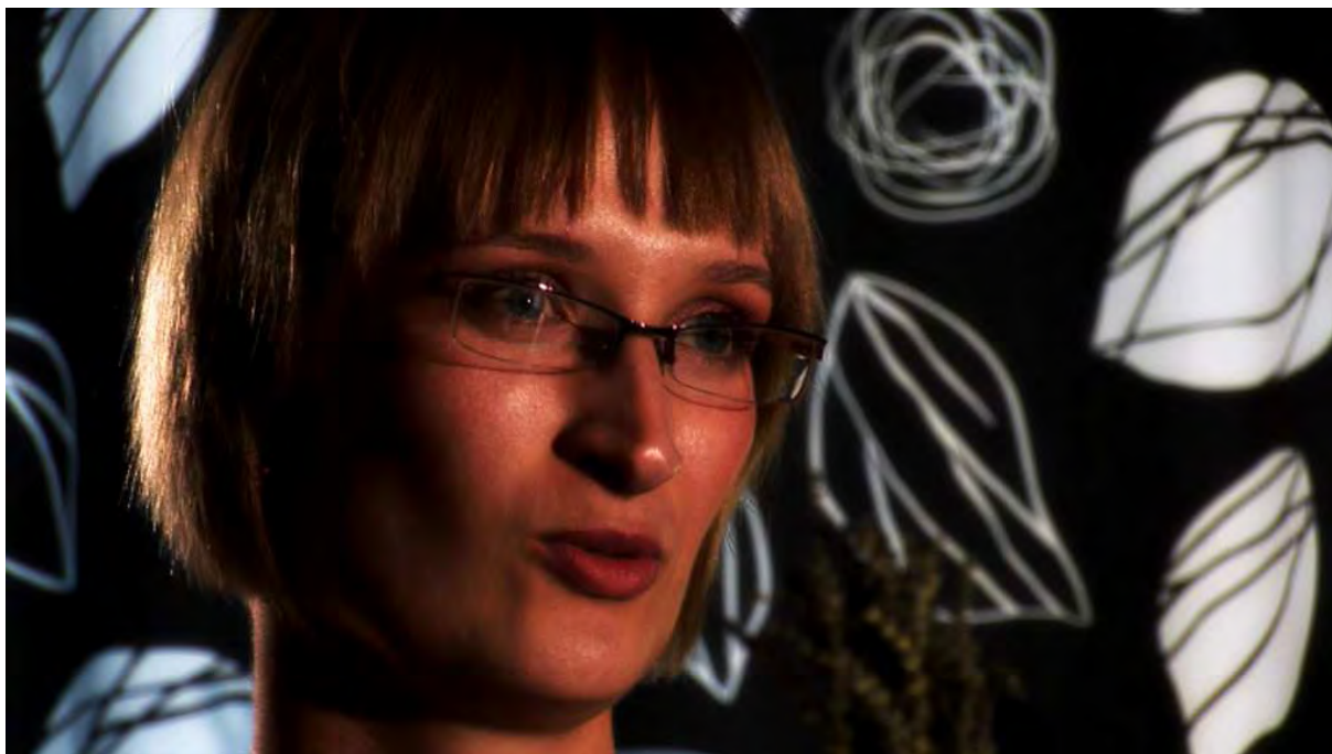
CÓRKA ALEKSANDRA, FOTOS Z FILMU „OKRUCHY ROZBITEGO DZBANA” 2011

Po 13.12.1981 roku uruchomił jedną z pierwszych podziemnych drukarni i współorganizował strukturę poligraficzną „Solidarność” Dolny Śląsk. Od 1982 roku w Solidarności Walczącej. W 1982 roku współzałożyciel Niezależnej Agencji Fotograficznej Dementi.