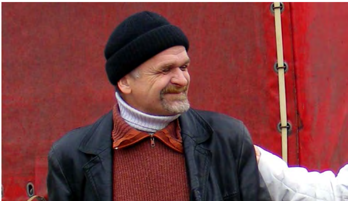
KRZYSZTOF GULBINOWICZ W 2009 ROKU, FOTOS Z FILMU „OKRUCHY ROZBITEGO DZBANA” 2011

Autorzy filmu wykorzystali wszelkie dostępne archiwalia – zarówno filmowe, jak i fotografie i dokumenty ze zbiorów prywatnych osób, które znały Krzysztofa Gulbinowicza, oraz z Instytutu Pamięci Narodowej, Archiwum Solidarności Walczącej i innych nieznanych dotąd źródeł. Twórcy o filmie: „Mamy nadzieję, że powstał ciekawy film dokumentalny, biograficzny, pokazujący, jak determinacja jednego człowieka, przepelnionego miłością do wolności, potrafiła przełamać wszelkie bariery i pokonała wszelkie przeciwności losu.”